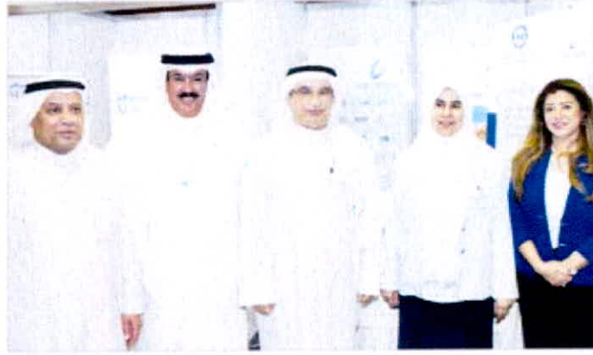
جناح الاتحاد في المعرض